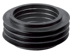
Figura di esempio