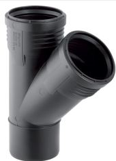
Figura di esempio