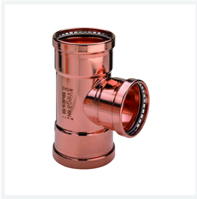
Raccordo a T Profipress XL con SC-Contur Modello 2418XL articolo 476 960