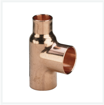
Raccordo a T Modello 95130 articolo 584 436