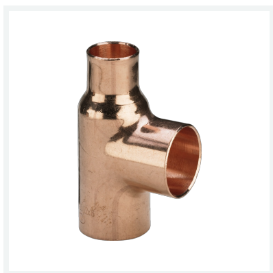
Raccordo a T Modello 95130 articolo 109 745