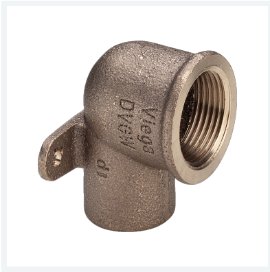
Gomito a 90° con flangia Modello 94472G articolo 113 490