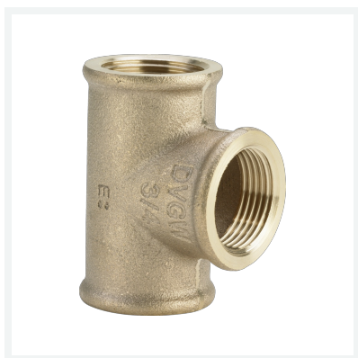
Raccordo a T Modello 3130 articolo 264 222