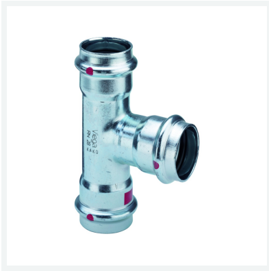
Raccordo a T Prestabo con SC-Contur Modello 1118 articolo 558 666