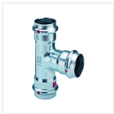
Raccordo a T Prestabo con SC-Contur Modello 1118 articolo 558 796