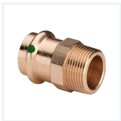
Manicotto Sanpress con SC-Contur Modello 2211 articolo 283 230