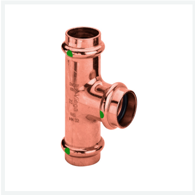
Raccordo a T Profipress con SC-Contur Modello 2418 articolo 291 952