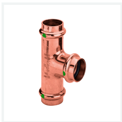
Raccordo a T Profipress con SC-Contur Modello 2418 articolo 291 969