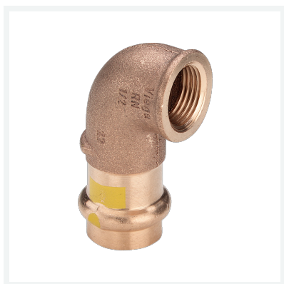
Gomito a 90° Profipress G con SC-Contur Modello 2614.2 articolo 345 822