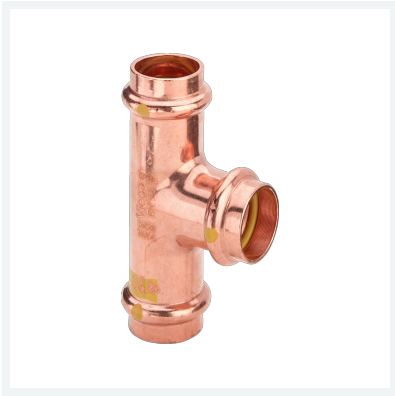
Raccordo a T Profipress G con SC-Contur Modello 2618 articolo 345 938