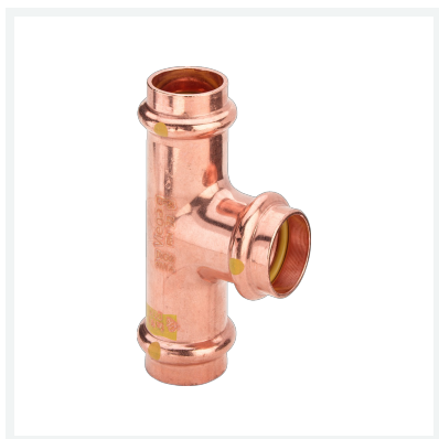
Raccordo a T Profipress G con SC-Contur Modello 2618 articolo 345 969