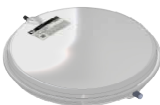
Disegno / Drawing 522/L