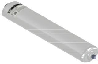
Disegno / Drawing 564