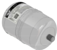
Disegno / Drawing 20016